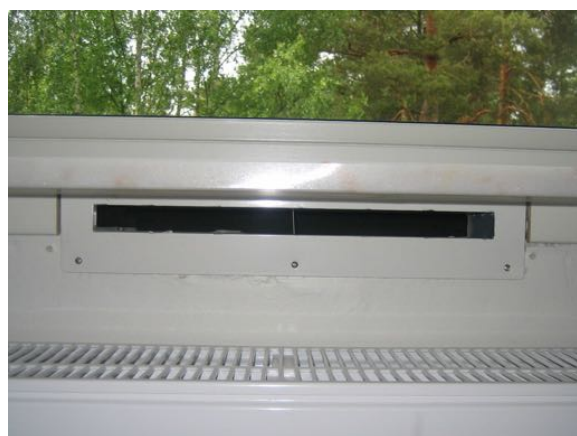
Öppen genomfö­ring för rengö­ring.