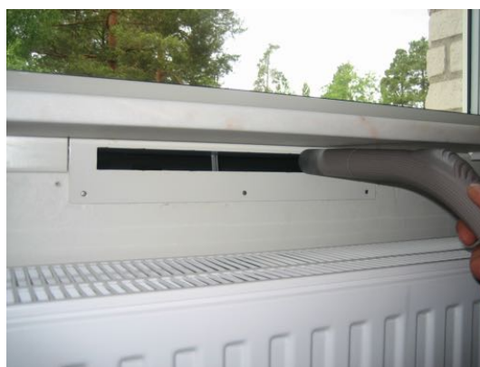
Dammsug och rengör genomfö­ringen.