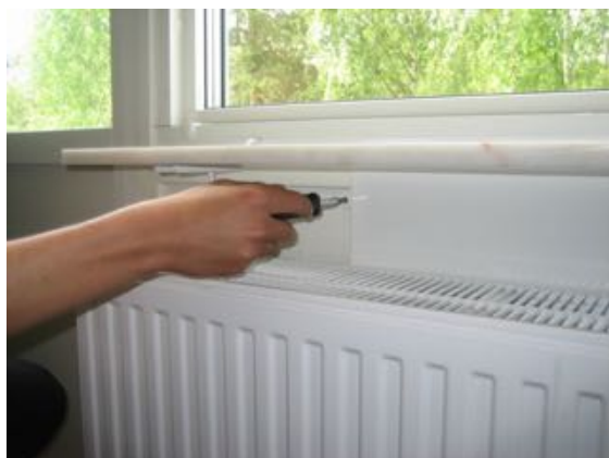
Skruva loss montageskruv för don.