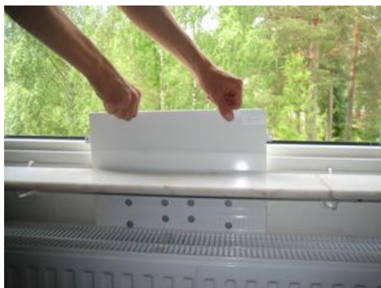
Lyft med båda händerna donet rakt upp. Donet kan sedan dammsugas.