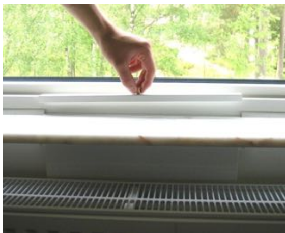
Lyft av locket.